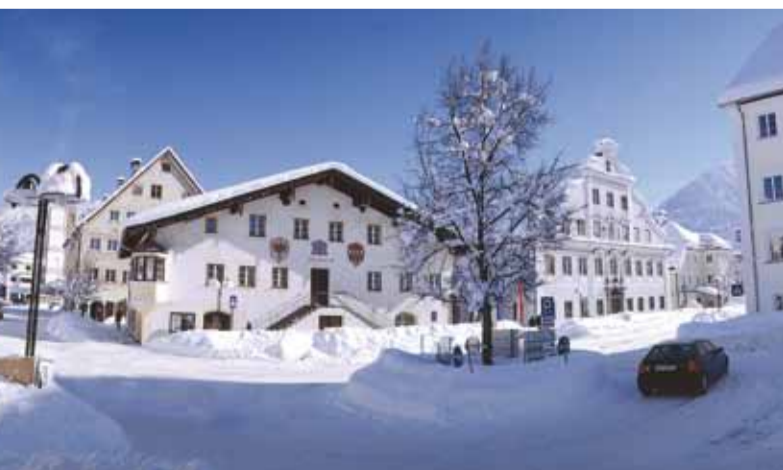
Ortskern von Reutte