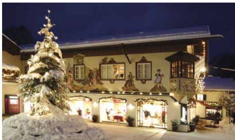
Garmisch-Partenkirchen zur Weihnachtszeit