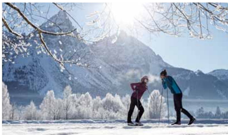
Beschneite Golfgrundloipe in der Tiroler Zugspitz Arena