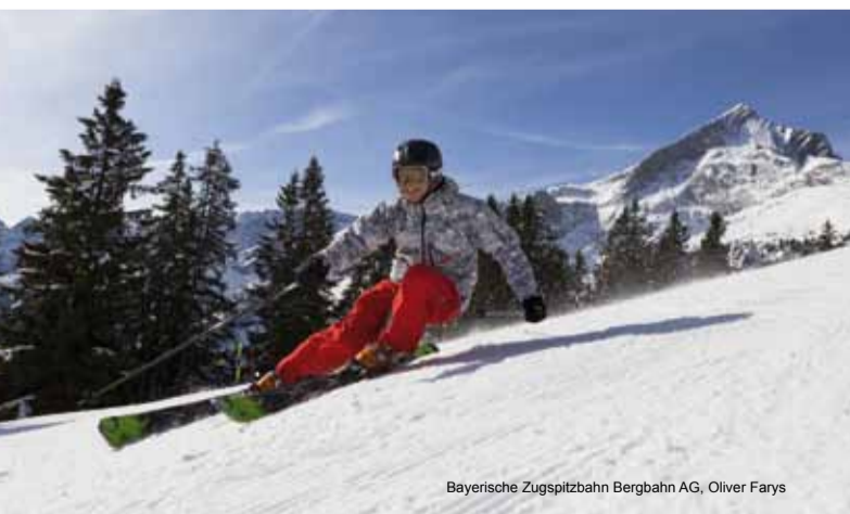
Bayerische Zugspitzbahn Bergbahn AG, Oliver Farys