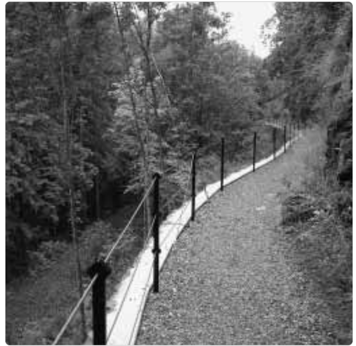
Der Röhrensteig, links darunter die freigeschnittene Trasse der Höllentalbahn.

und ein Wanderweg jenseits der Selbitz. Es wird still im Tal, das Rauschen des Flusses und der Blätter nimmt den Wanderer gefangen. Auch an einem Werktag sind etliche Wanderer unterwegs. 150 Meter tief hat sich die Selbitz in die Felsen eingeschnitten, sie rauscht auf vier Kilometern um 50 Höhenmeter hinab.