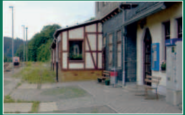
Bahnhof Blankenstein: der Blick nach Süden in Richtung Höllental.