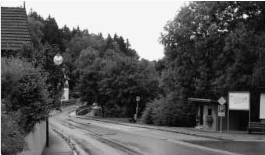
Hölle, Ortsmitte: Hier war der Bahnübergang.