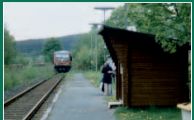
Marxgrün: Ganz weit weg von Berlin und München ist die Regionalisierung noch nicht angekommen.