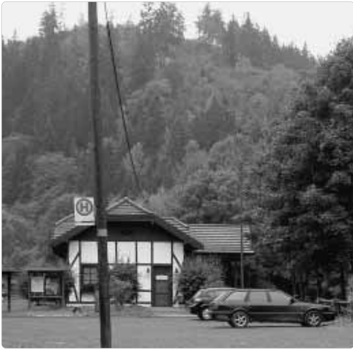
Der Bahnhof Lichtenberg beherbergt ein Informationszentrum des Naturparks Frankenwald.