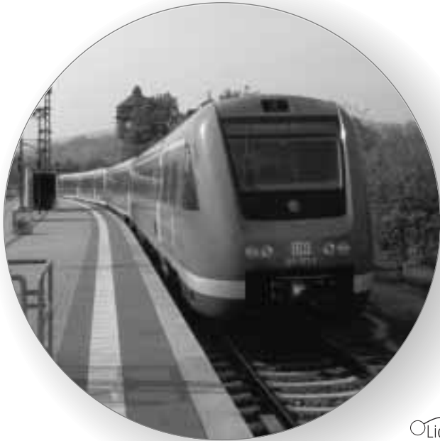
186 Kilometer nach Hof: Der Regionalexpress steht in Saalfeld abfahrtsbereit. Der direkte Schienenweg misst ganze 80 Kilometer.

Lebt der Stacheldraht in den Köpfen weiter?