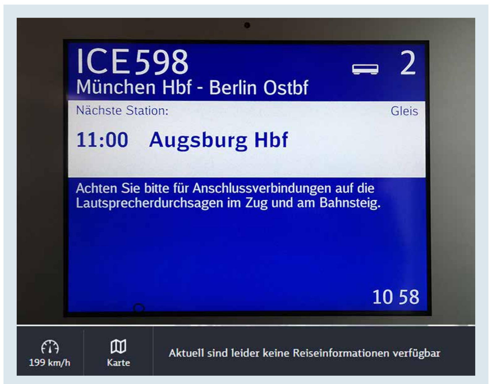
Bild 5: Ohne Daten kann weder die Anzeige (oben) das Gleis und die Anschlüsse anzeigen noch das ICE Portal (unten) Informationen liefern.

Weiterhin sind die Informationen über die Serviceleitungen der Halte-Bahnhöfe nicht direkt und einfach für jeden verständlich auffindbar. Der Link zum Service auf dem nächsten Haltebahnhof befindet sich ganz unten unter „Unsere Tipps zum nächsten Halt“ nach den Wetter, der Werbung und touristischen Informationen. Dort ist auf die Seite „bahnhof.de“ von DB Station und Service verlinkt. Bei einigen Halten wird dieser Link erst durch einen weiteren zusätzlichen Klick auf „Stadt entdecken“ angezeigt. Während unserer Tests waren die ICE-Bahnhöfe München-Pasing und Frankfurt Flughafen Fernbahnhof mit den Informationen des jeweiligen Hauptbahnhofs verlinkt. Beim ICE-Halt in Köln Messe/Deutz führte der erste Link zum Kölner Hauptbahnhof, der mit den Informationen zum Bahnhof Messe/Deutz befand sich an dreizehnter und letzter Stelle der verlinkten Informationen. Wer diesem Pfad gefolgt ist, findet beispielsweise auch Informationen zu gegebenenfalls vorhande-