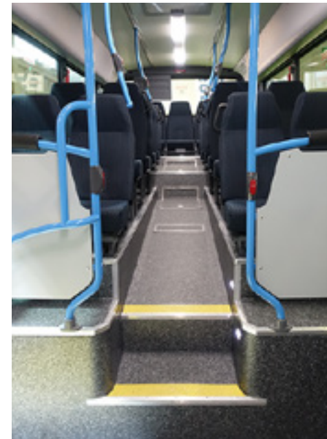
In der sogenannten Versio Low Entry werden die Stufen etwas besser verteilt.

Dabei weist ein guter Teil der heute von den Omnibusverkehrsunternehmen beschafften sogenannten Niederflurbusse überwiegend nur noch zwischen erster und zweiter Tür ohne Stufen erreichbare Sitzplätze und einige Niederflurbusse auch dort nur noch mit einer Stufe erreichbare Sitzplätze auf. Aus der Sicht des Fahrgastverbandes PRO BAHN reicht es jedoch nicht, die Barrierefreiheit auf den Ein- und Ausstieg zu begrenzen.