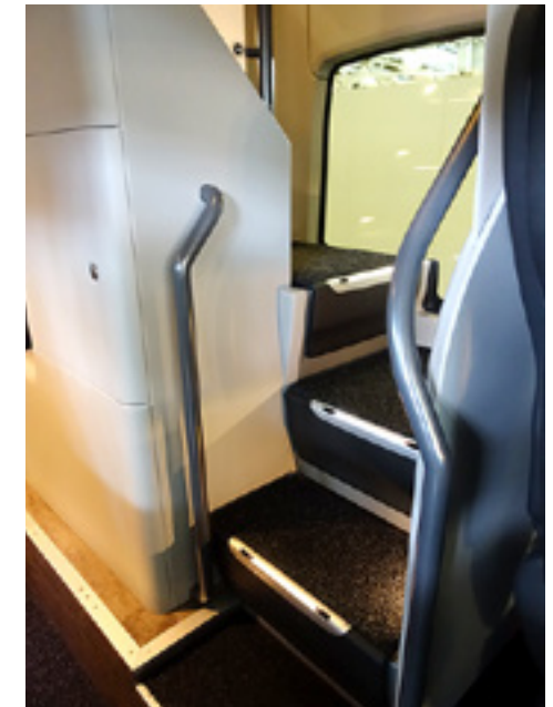
Im Doppelstock-Bus geht es nicht ohne Stufen, muss die Treppe aber so eng und steil sein?