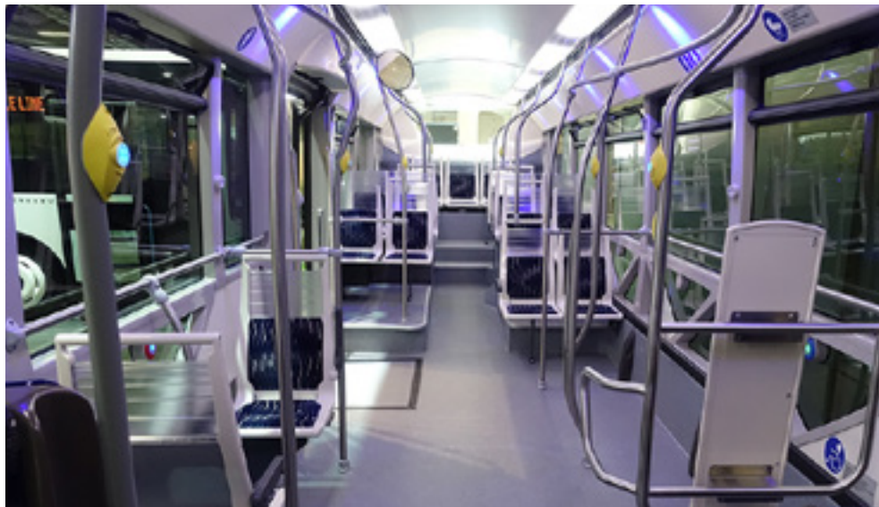
Im vorderen Teil ist der GX 337 elec des Herstellers Heuliez barrierefrei, im hinteren Teil folgen steile Stufen.

Im März 2019 konnten die Besucher der Messe Bus2Bus in Berlin wieder einmal besichtigen, was die Busbranche unter Barrierefreiheit versteht: